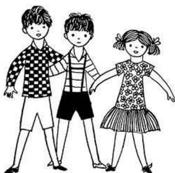
Lasse Bosse Lisa

Astrid Lindgren zmarła w Sztokholmie w 2002 r. w wieku 94 lat.